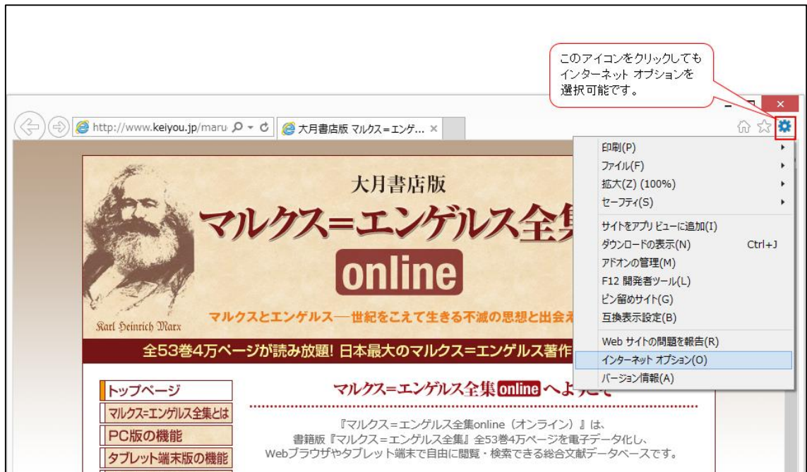
図 3 アイコンからインターネット オプションを開く

Internet Explorer の画面右上に歯車のアイコンがある場合は、これをクリックし、「インターネット オプション」をクリックしても構いません。