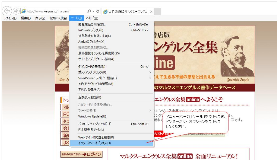
図 2 [ツール]からインターネット オプションを開く

Internet Explorer の画面右上に歯車のアイコンがある場合は、これをクリックし、「インターネット オプション」をクリックしても構いません。