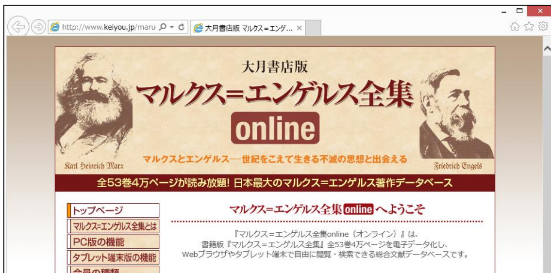
図 1 Internet Explorer 起動